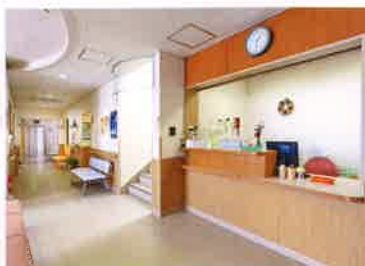
1 受付(大久保クリニック外来と併設)

保健医療機関との密接な連携はもとより、併設する診療所の医師や施設に常勤する看護師が急変時などの対応も迅速に行います。ご利用者さま、ご家族さまが安心できる運営とサービスの向上に努めています。