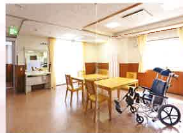
2 食堂・デイルーム